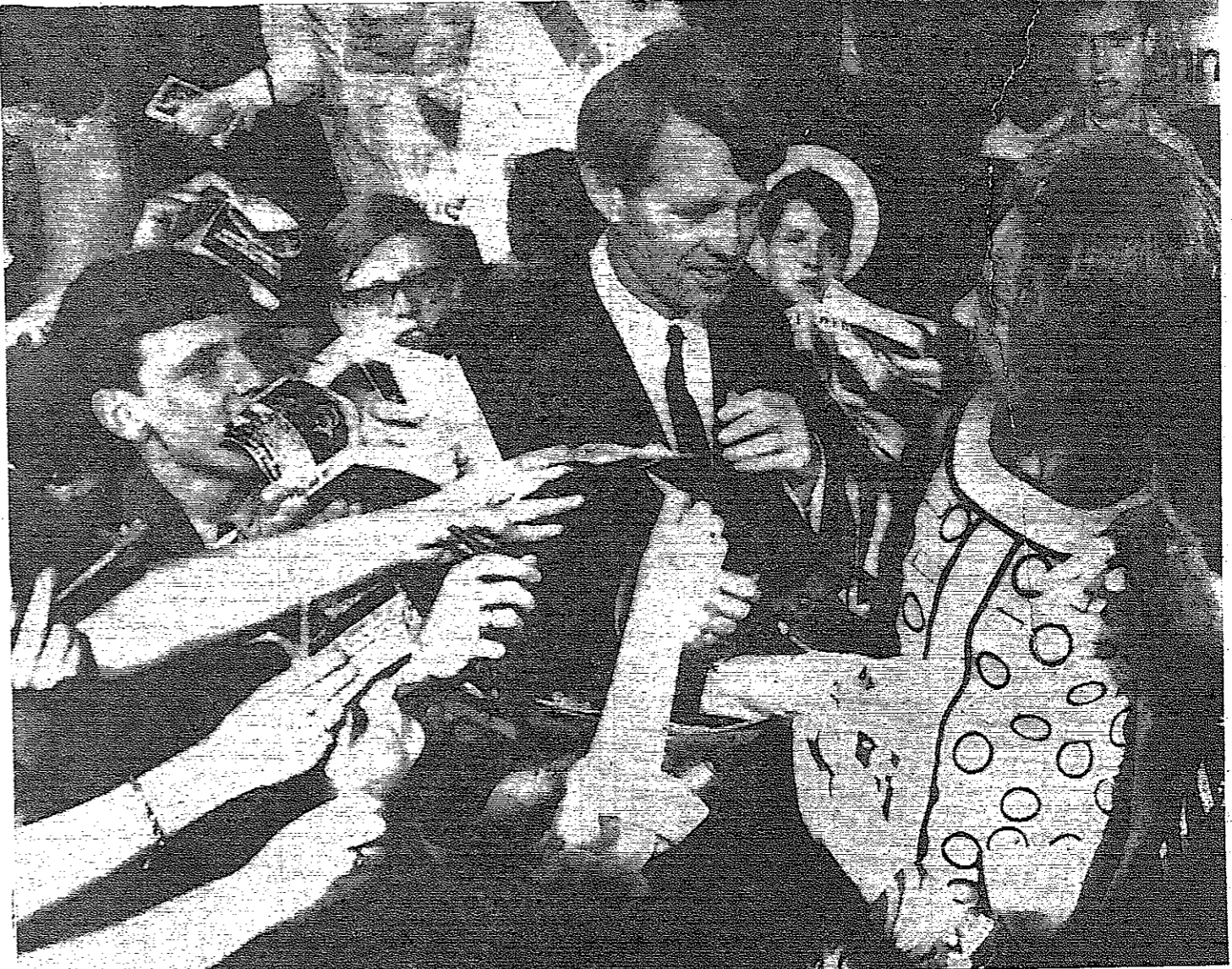
الاستاذ روبرت كيدي وزوجته خلال جولته الانتخابية يحيط به امالي مدينة اوماها في نبراسكا للحصول على توقيعه على الوثائق المسورة

اتنا - رويتر - ذكرت صحيفة فرديني الصادرة هنا ان طران الروم الارثوذكس في اثيوبيا كان في غرب اليونان مع الكهنة في مقبضه من التحسين لان ذلك لا يتفق مع رسالتهم... خسر حياته... وقبيل في اثبات قوته لزوجته... ثابه - رويتر - راهن قروي في السمين من عونه في جنوب تاوان زوجته على انه قوي الى درجة يستطع معها تجرع السم... وقال الوبليس ان الرجل كان يحاول ان يفت زوجته التي شككت في قدرته انه «قوي مثل الثور»!